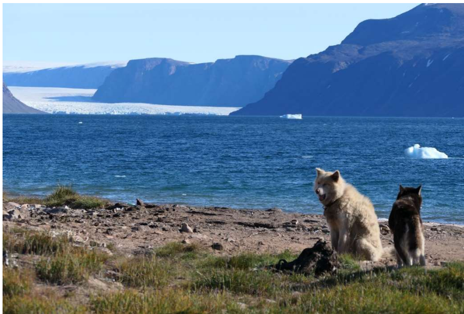
Siorapaluk, NW-Grönland

Das Nordpolargebiet ist in den Kerncurricula Geographie Niedersachsens oder auch den Fachanforderungen Schleswig-Holsteins in den prozessbezogenen Kompetenzen, in der räumlichen Orientierung und den grundlegenden topographischen Wissensbeständen verankert. In Bremen ist sie in den Bildungsplänen Sek I im Themenbereich Planet Erde (7/8 Jahrgangsstufe) zu finden. Hamburg greift die Arktis im Rahmenplan Geographie ebenfalls in der 7./8. Jahrgangsstufe im Themenfeld 2.2 Orientierung: Gradnetz, Klima- und Vegetationszonen auf.